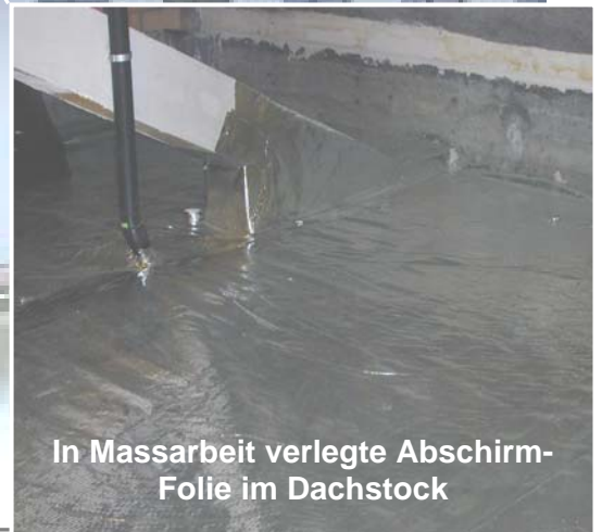
In Massarbeit verlegte Abschirm-Folie im Dachstock

Bettlzentrum Dübendorf: GSM-Basisstationen von Sunrise und Swisscom auf demselben Dach. An die Signalstärke angepasste Gebäudeabschirmung mit einer Spezialfolie ermöglicht kostengünstig den Ausbau auf UMTS.